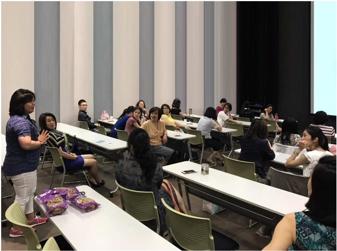
社姐踴躍發問與互動